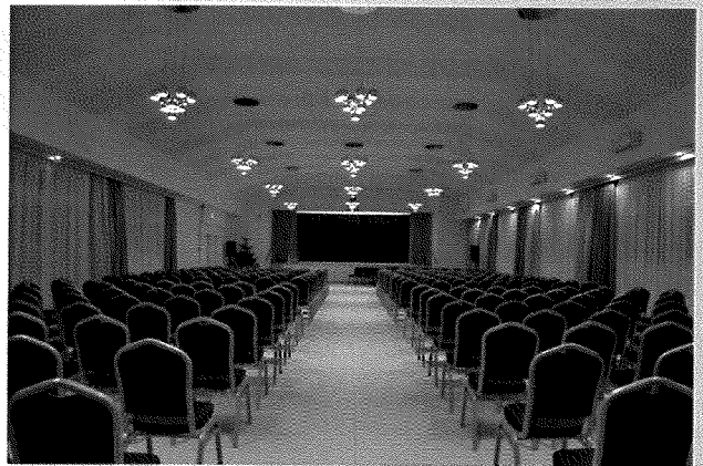
Színházterem Gyermek könyvtár