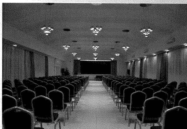
Színházterem Gyermek könyvtár